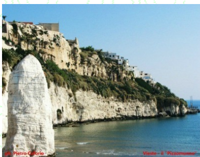
Monte - il Pizzomunno

PASQUA 2012: DA VENERDÌ 6 A LUNEDÌ 9 APRILE