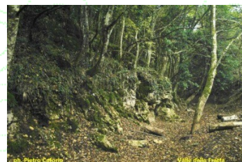
Valle Carbonara