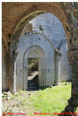
Monte Sacro - Abbazia SS. Maria

La proposta è adatta a tutti , anche a coloro che sono poco allenati, una esperienza di cammino di più giorni, modulare in quanto avremo un mezzo al seguito che, oltre fare il trasporto del bagaglio pesante, potrà facilitare coloro che sono alla prima esperienza.