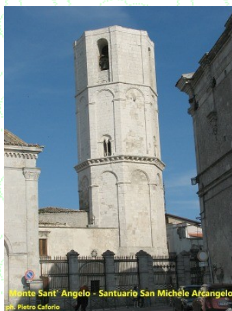
Monte Sant' Angelo - Santuario San Michele Arcangelo

Per informazioni ed iscrizioni, contattare la Segreteria ai seguenti recapiti: telefono : 0731.212293 - 338.2382647 - e-mail info@trekebike.it ; sito internet : www.trekebike.it